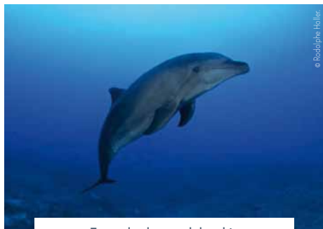
Exemple : le grand dauphin

Présents sur Terre depuis 2 à 5 millions d'années, les cétacés (baleines et dauphins) sont des mammifères marins (respiration à l'aide de poumons, viviparité, allaitement, présence de poils, homéothermie). Ils sont classés en 14 familles et sont répartis en 87 espèces. Les cétacés sont divisés en deux sous-ordres : les odontocètes (cétacés à dents) et les mysticètes (cétacés à fanons).