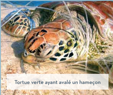
Tortue verte ayant avalé un hameçon

Ces quantités considérables de déchets déstabilisent totalement les biotopes marins. De nombreuses espèces ingèrent ces substances polluantes et les stockent dans leurs tissus ou s'en retrouvent prisonnières et en meurent.