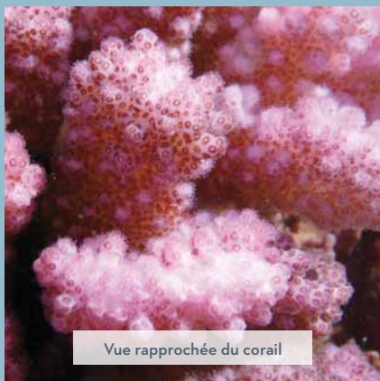
Vue rapprochée du corail