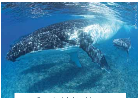
Exemple : la baleine à bosse

Les odontocètes ne possèdent qu'un seul évent (office respiratoire).