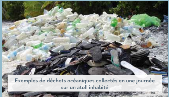
Exemples de déchets océaniques collectés en une journée sur un atoll inhabité