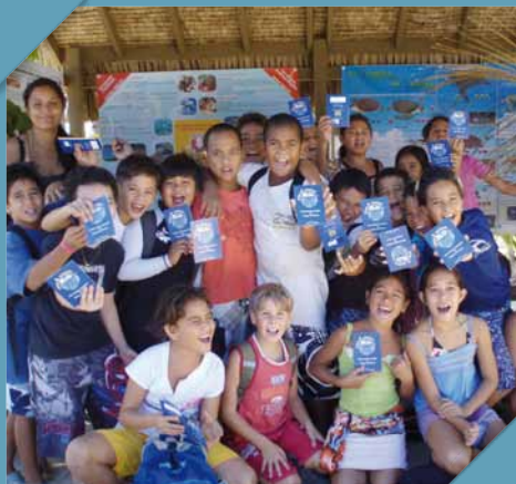
Jeunes écoliers de Moorea célébrant la Journée Mondiale des Océans, le 8 juin.

Une grande majorité des destinations proposées sont bordées par les océans, d'où l'importance de notre engagement aux côtés de l'association Te mana o te moana , basée en Polynésie française. La protection des océans est primordiale pour conserver le fragile écosystème marin de notre planète bleue et sa beauté. Vous aussi, lors de vos futurs voyages, vous allez devenir des acteurs importants du changement !